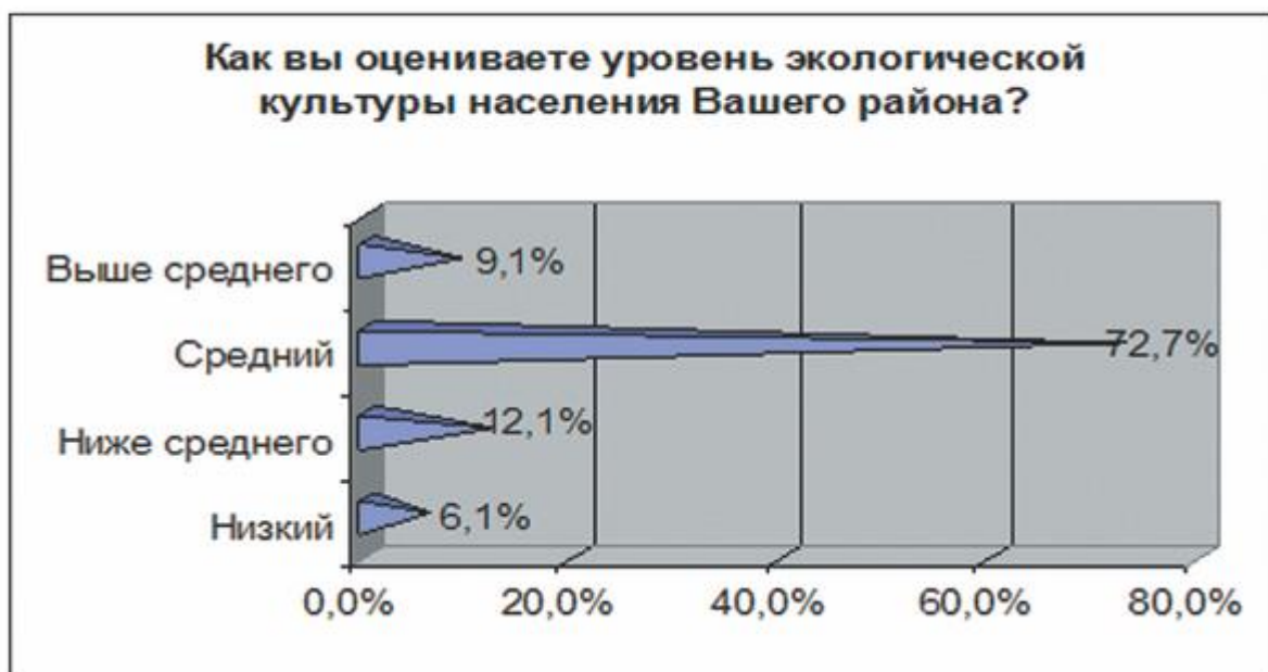
Диаграмма № 4. Уровень экологической культуры населения

Более 70 % респондентов оценивают уровень экологической культуры населения как средний. Но остальные ответы перевешивают положительную оценку, т. е. можно сказать, что, по мнению руководителей, уровень экологической культуры НСО немного ниже среднего.