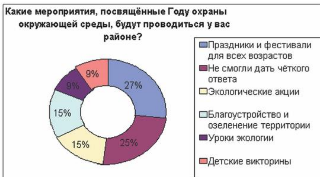
Диаграмма № 3. Формы мероприятий, планируемых в районах по тематике года

Самой популярной формой оказалась «Праздник и фестиваль для всех возрастов». Были названы видеофестиваль «Зелёная планета», «День Карася», «День птиц», «День Земли», «День рыбака», «Начало посевной»). Экологические акции и благоустройство и озеленение территории можно отнести на второе место среди мероприятий. Из акций были названы: «Чистый берег», «Чистый лес», «Чистое село», «Живи лес», «Первоцвет». Уроки экологии, викторины и праздники для детей занимают третье место. Четверть руководителей не смогли дать чёткого ответа. Помимо этого единожды назывались: беседа-диалог «Сохраним природу вместе», экологический молодёжный десант, экологический КВН, комплекс мероприятий «Экология и мы», районная выставка на экологическую тематику, распространение буклетов и листовок, экологические программы «Природа России» и «Путешествие по зелёному миру», тематический вечер «Планету нашу охраняем», экскурсии на пенькообрабатывающий завод, открытие парка, а также конкурсы: